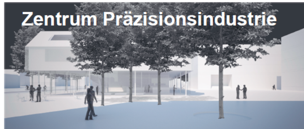
Visualisierung möglicher zentraler Aufenthaltsbereich